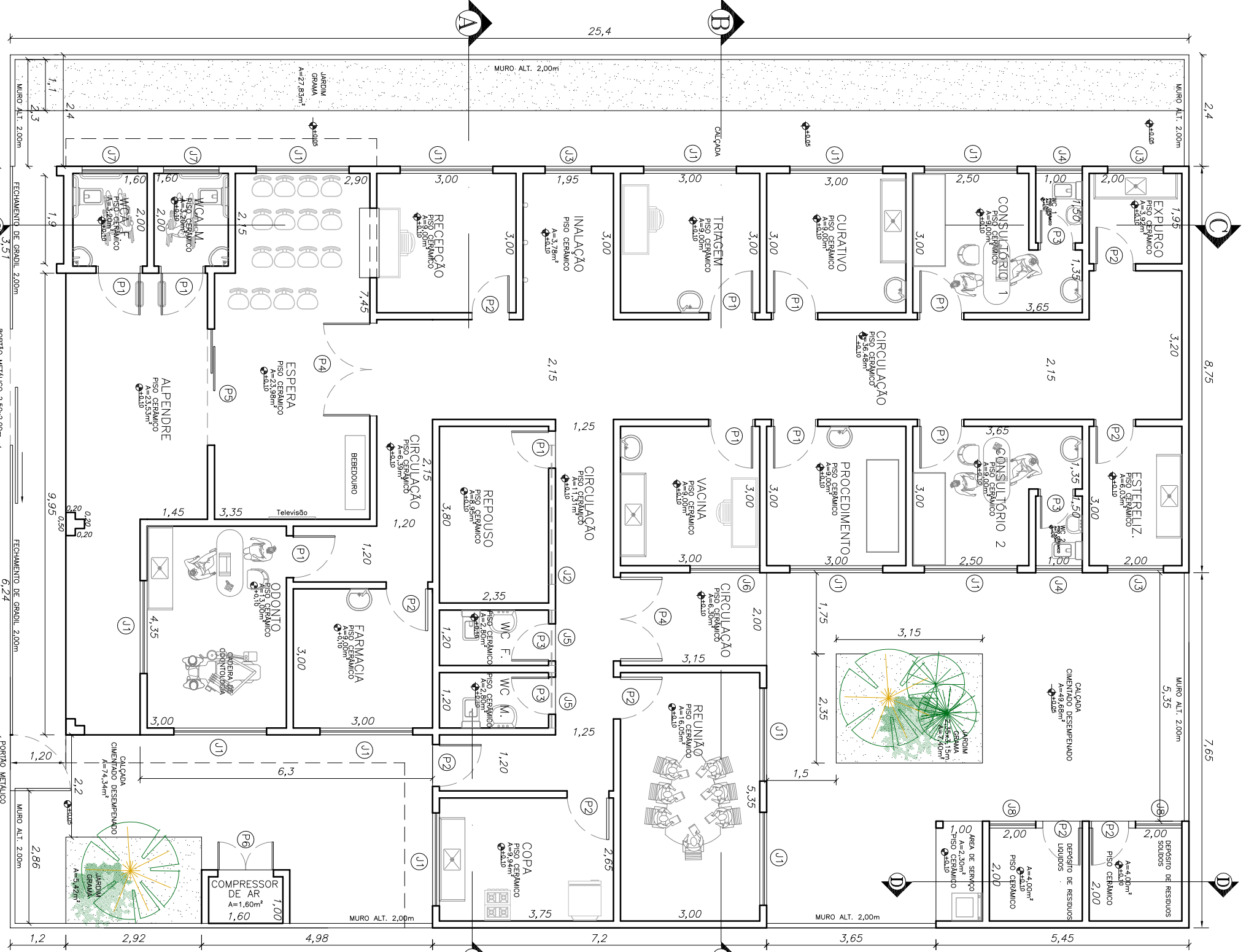
PLANTA BAIXA ESC.1:100